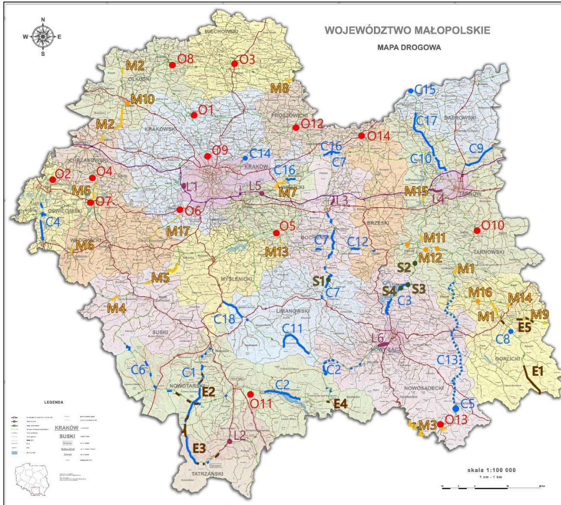
Rys.2. Planowane inwestycje drogowe w Małopolsce do roku 2023.